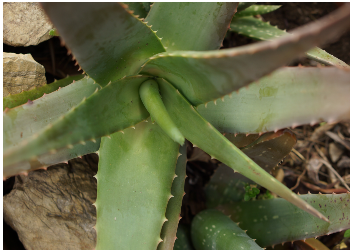
L'Aloe vera, Aloe vera, Aloécacées