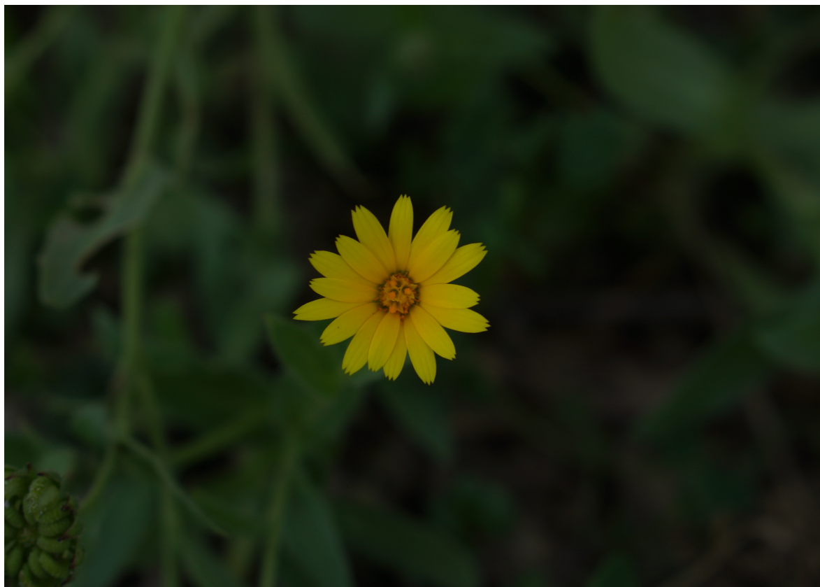
Le Souci des champs, Calendula arvensis, Astéracées